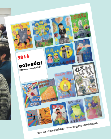
平成28年選挙啓発カレンダー

平成27年11月28日（土曜日）13時30分から 浦和コミュニティセンター第15集会室にて