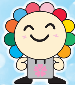
さいたま市選挙キャラクター みらいくん